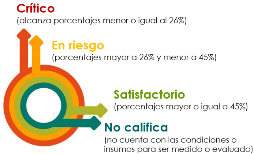
Figura 1 Clasificación de Metas Semestrales, según resultado. I Semestre 2024