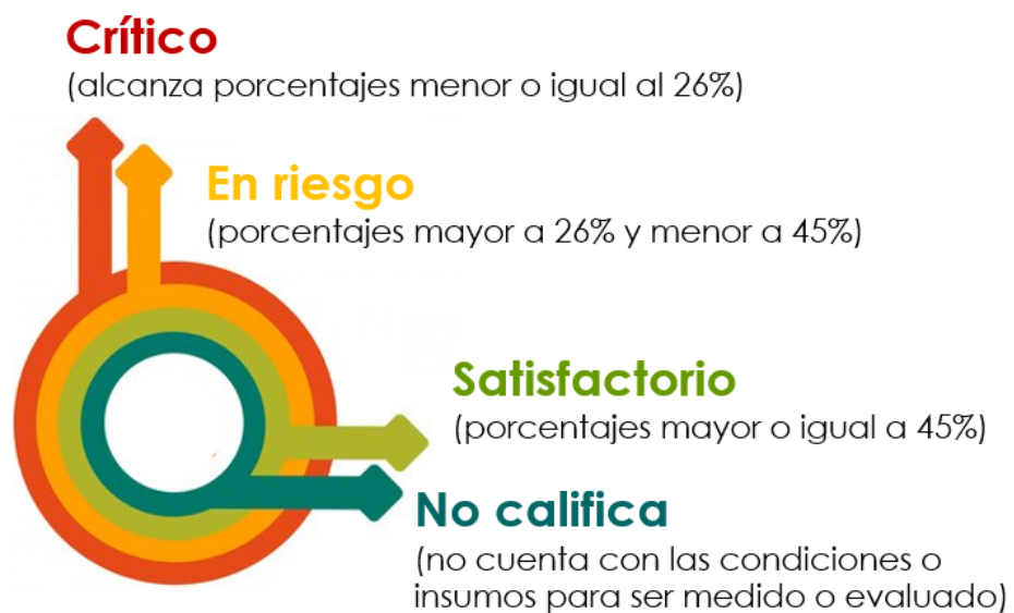
Figura 1 Clasificación de Metas Semestrales, según resultado. I Semestre 2024