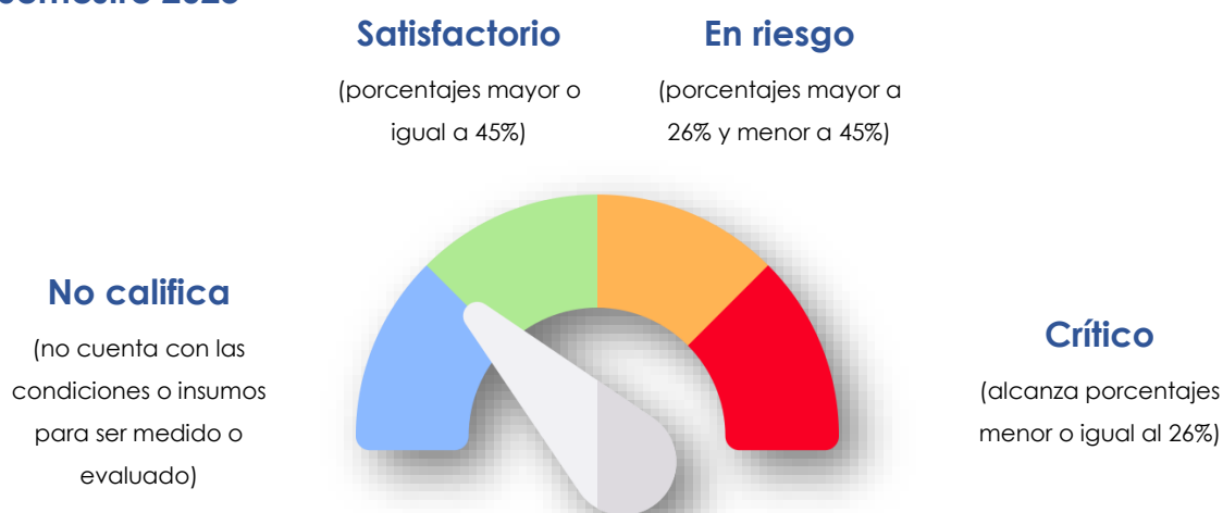
Figura 1. Clasificación de Metas Semestrales, según resultado. I Semestre 2023