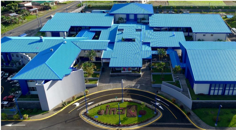
Vistas aéreas del estado actual del Centro con proyecto de pintura ejecutado en 2019

A manera de ejemplo, para el último año de mi gestión (2019) se realizó en tiempo record el proceso de mantenimiento en pintura para el centro de Formación Profesional Monseñor Sanabria.