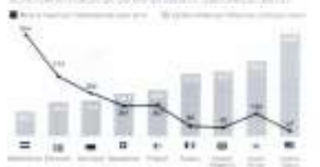
Imagen 1 - Ciclistas en bicicleta por país y número de accidentes fatales de bicicletas por millón de ciclistas.

Entre los beneficios para el sector de usar la bicicleta y caminar, se encuentra mayor flexibilidad económica analizada. Los beneficios económicos de actividad física mejoran en sus consumidores, se reducen sustancialmente los riesgos de problemas económicos, de salud, de salud y otros relacionados con la actividad física, como un ejemplo una copia mejor para el Canadá, en específico para la Caja Costarricense de Seguro Social (Caja Costarricense de Seguro Social) que en términos generales, al usar la bicicleta incrementa una mejora en la calidad de vida para personas de