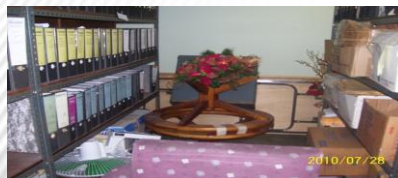
Acumulación de objetos en mal estado ...