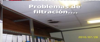
Problemas de filtración....