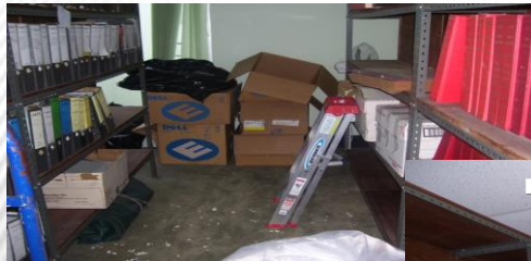
Forma inadecuada de conservación documental....