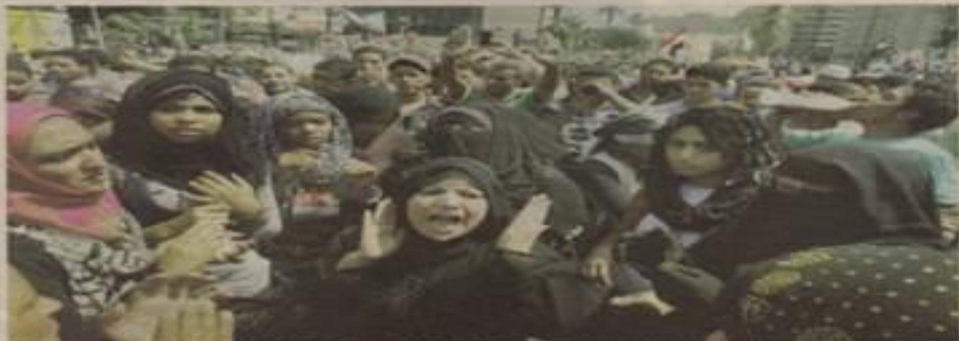
Mujeres protestaron el 18 de junio en la Plaza Tahrir (El Cairo), donde han sido víctimas de numerosos abusos.

En noviembre de 2011, una periodista del canal de televisión